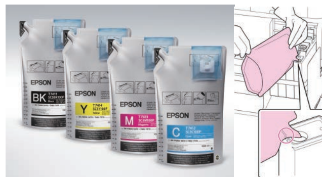
1公升補充包，隨包搭配感應晶片，晶片需隨同墨水一起更換，當墨水槽內的存量不足時，會透過晶片啟動警示燈號。