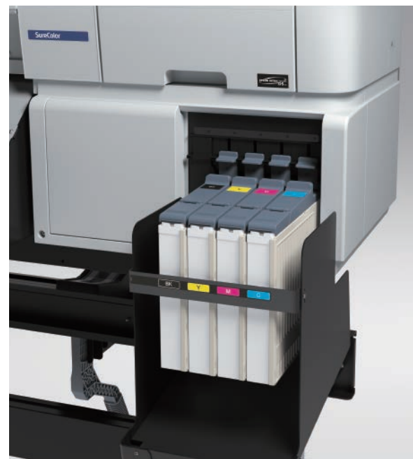
大容量1.5公升墨水槽，青、洋紅、黃、黑四色。

SC-F系列提供 1.5 公升墨水槽搭配墨水補充包，除了可以滿足大量列印生產時，減少更換墨水匣的次數的需求外，還能在列印過程中，透過墨水補充警示系統，提醒使用者適時更換墨水晶片與補充墨水。墨水槽濾網的設計，可以保護噴頭免於雜物進入以及延長噴頭壽命，讓您的列印過程更順暢，不再因停機而減少商機。